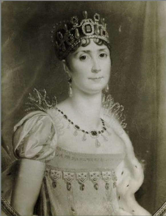
JOSEFÍNA, PRVNÍ NAPOLEONOVA MANŽELKA