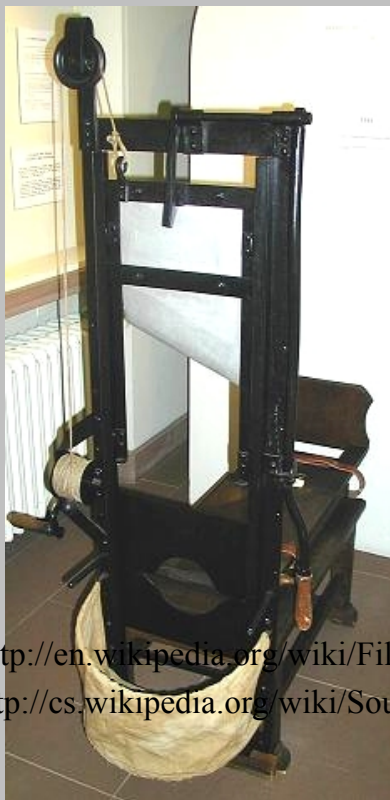
GILOTINA POPRAVČÍ NÁSTROJ