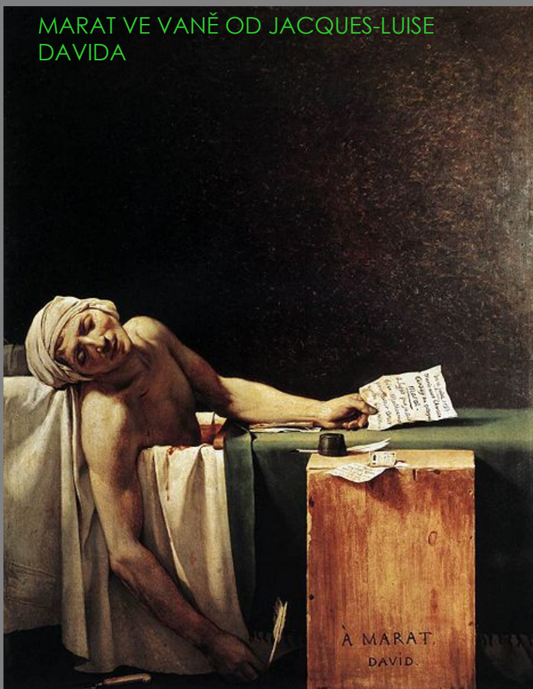
MARAT VE VANĚ OD JACQUES-LUISE DAVIDA