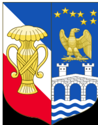
EUGENIE CLARY, BERNARDOTTE